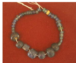
石鏃(向出遺跡) ガラス玉(玉田山1号墳)