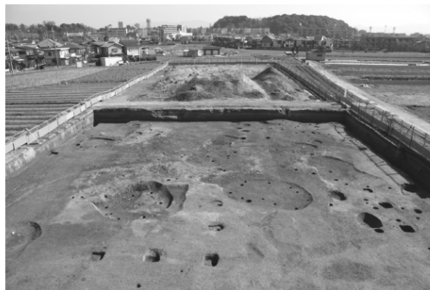
図3 2006年度調査 縄文時代全景(西から)