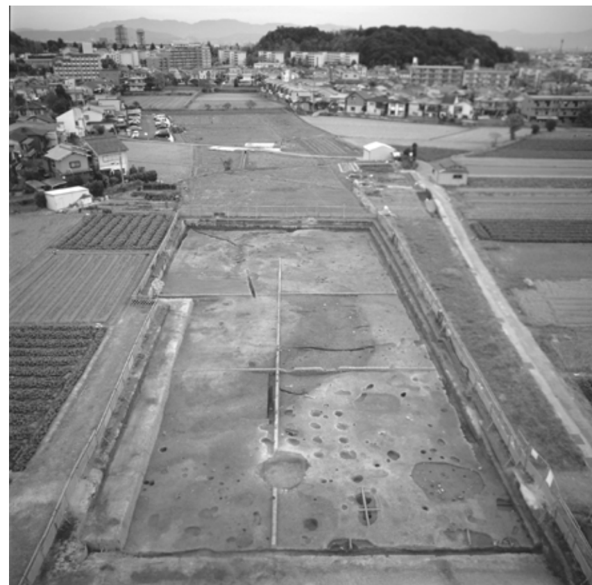
図2 2007年度調査 縄文時代全景(西から)